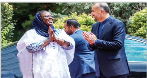
دیدار وزیر امور خارجه بوركینافاسو با امیر عبداللهیان