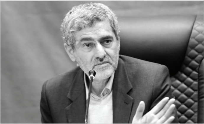
استاندار فارس در دومین جلسه ستاد باز آفرینی شهری:

مدیریتی استان نیست اما قطعاً این موضوع را از طریق ریاست‌جمهوری پیگیری می‌کنم چرا که در افزایش سرعت بازآفرینی شهری مؤثر است.