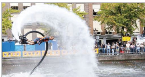
مراسم افتتاحیه یک مسابقه خیره‌بر شنا در شهر آمستردام هلند