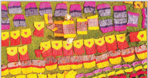
خشک کردن پارچه‌های رنگ آمیزی شده در بنگلادش