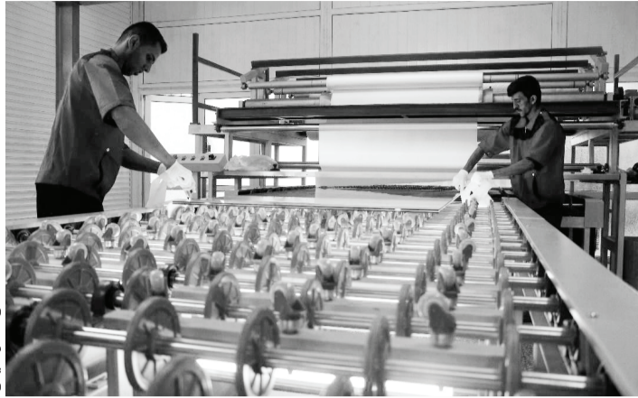
کارگران در کارگاه تولیدی

مشمول طبقه‌بندی قرار بدهند. به اعتقاد کارشناسان و فعالان حوزه کار، طبقه‌بندی مشاغل بهترین معیار برای صدور احکام شغلی کارگران است و موجب می‌شود از نیروهای کار در کارگاه‌ها و مجموعه‌ها بر اساس شایستگی استفاده شود.