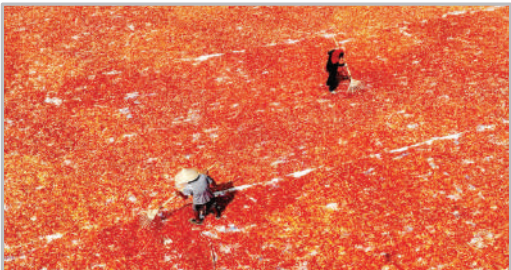
کشاورزان در بوژو چین لفل قرمز را بهن می‌کنند تا خشک شود